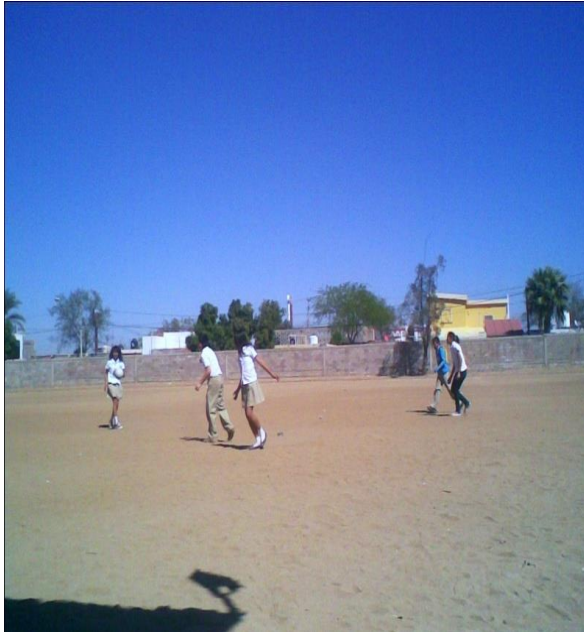
Adolescentes (hombre y mujeres) practicando el volibol reto.

Enseguida mostraré en unas fotos de las diversiones más frecuentes