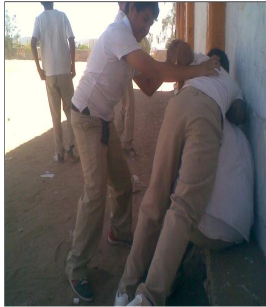
Adolescentes (hombres) divirtiéndose practicando la bolita