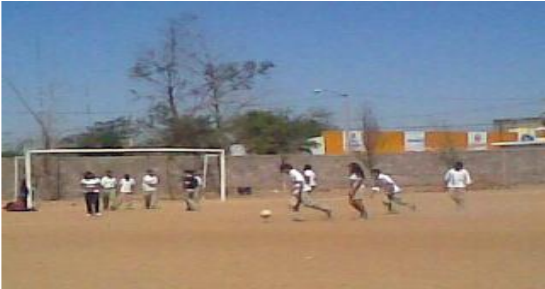
Fuente: Bertha Eunisse Gutiérrez García. Adolescentes (hombres y mujeres) jugando el futbol

Enseguida mostrare unas fotos de los juegos y deportes más frecuentes entre los estudiantes