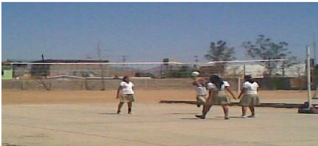
Adolescente (mujeres) jugando vólibol en la cancha3.