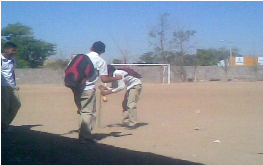
Adolescentes (hombre) llenando una botella de plástico para tirarla a otro compañero.

A continuación se mostrara una tabla de las diferencia entre diversión y juego.