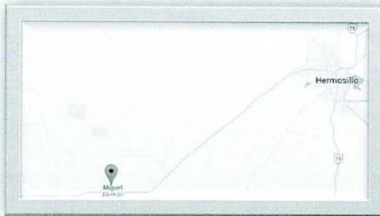
Figura 3. Indicación de la localización del Poblado Miguel Alemán en el mapa del municipio de Hermosillo, Sonora, México